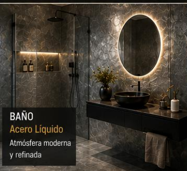
BAÑO Acero Líquido Atmósfera moderna y refinada