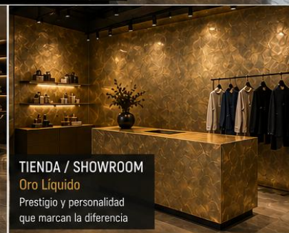
TIENDA / SHOWROOM Oro Líquido Prestigio y personalidad que marcan la diferencia