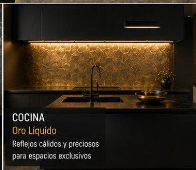
COCINA Oro Líquido Reflejos cálidos y preciosos para espacios exclusivos