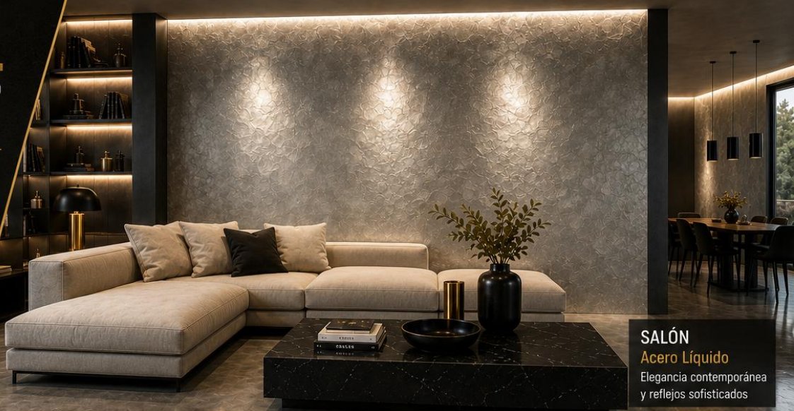
SALÓN Acero Líquido Elegancia contemporánea y reflejos sofisticados