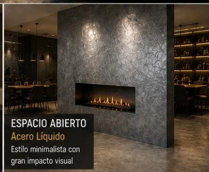
ESPACIO ABIERTO Acero Líquido Estilo minimalista con gran impacto visual