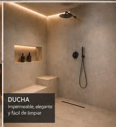
DUCHA Impermeable, elegante y fácil de limpiar