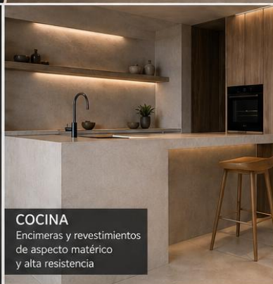
COCINA Encimeras y revestimientos de aspecto matérico y alta resistencia