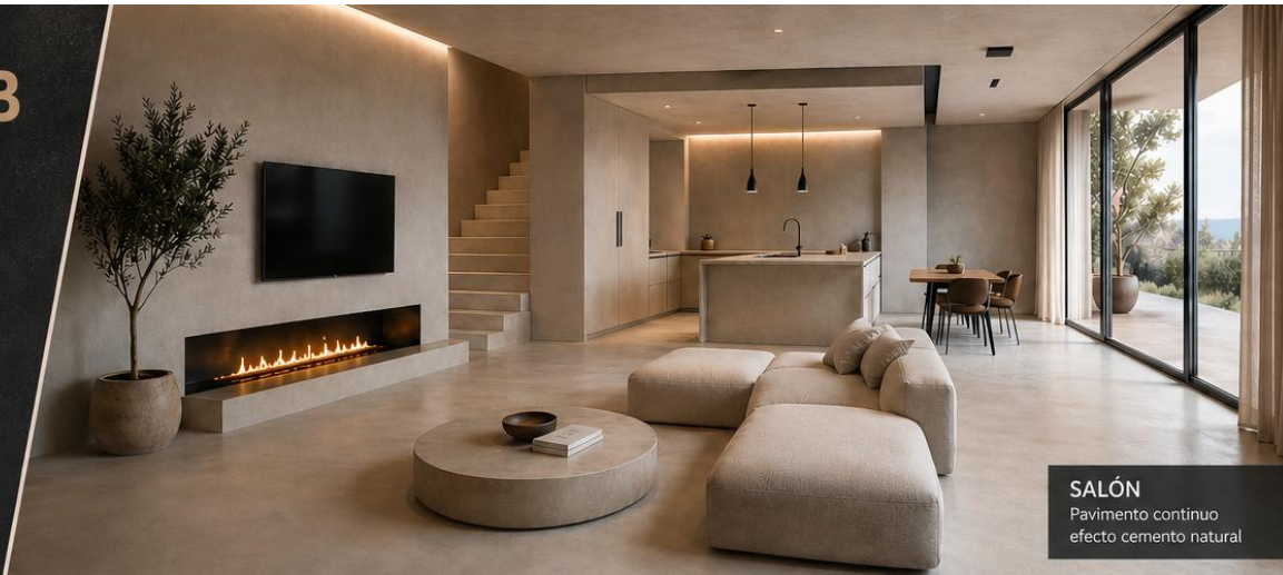
SALÓN Pavimento continuo efecto cemento natural