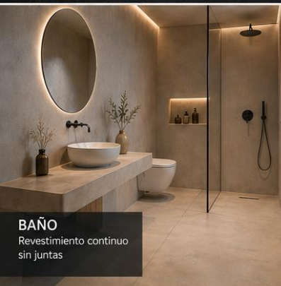
BAÑO Revestimiento continuo sin juntas