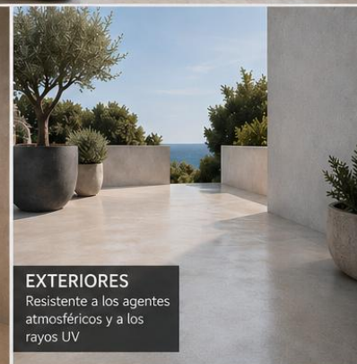
EXTERIORES Resistente a los agentes atmosféricos y a los rayos UV