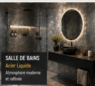
SALLE DE BAINS Acier Liquide Atmosphère moderne et raffinée