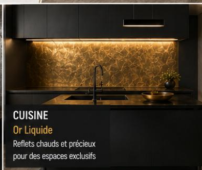
CUISINE Or Liquide Reflets chauds et précieux pour des espaces exclusifs