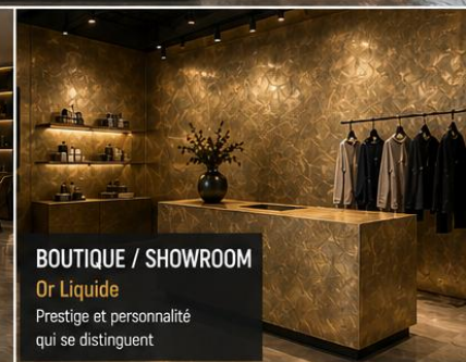
BOUTIQUE / SHOWROOM Or Liquide Prestige et personnalité qui se distinguent