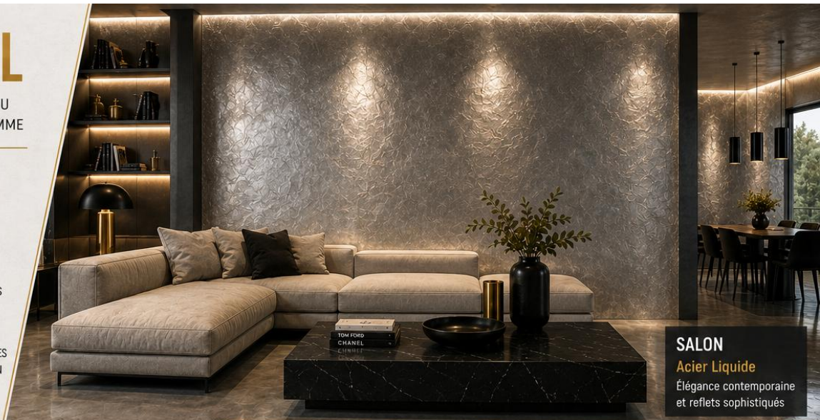
SALON Acier Liquide Élégance contemporaine et reflets sophistiqués