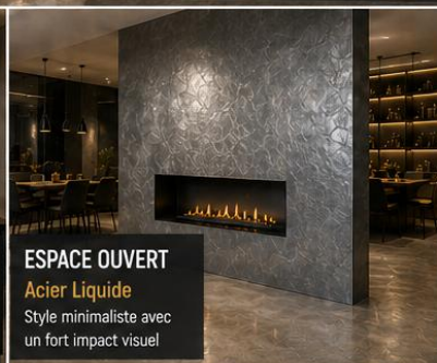
ESPACE OUVERT Acier Liquide Style minimaliste avec un fort impact visuel