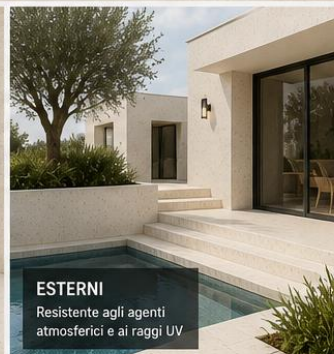
ESTERNI Resistente agli agenti atmosferici e ai raggi UV