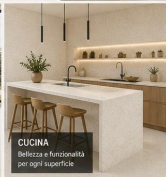
CUCINA Bellezza e funzionalità per ogni superficie