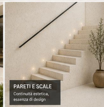
PARETI E SCALE Continuità estetica, essenza di design

ECCELLENTE ADESIONE SU SUPPORTI ESISTENTI