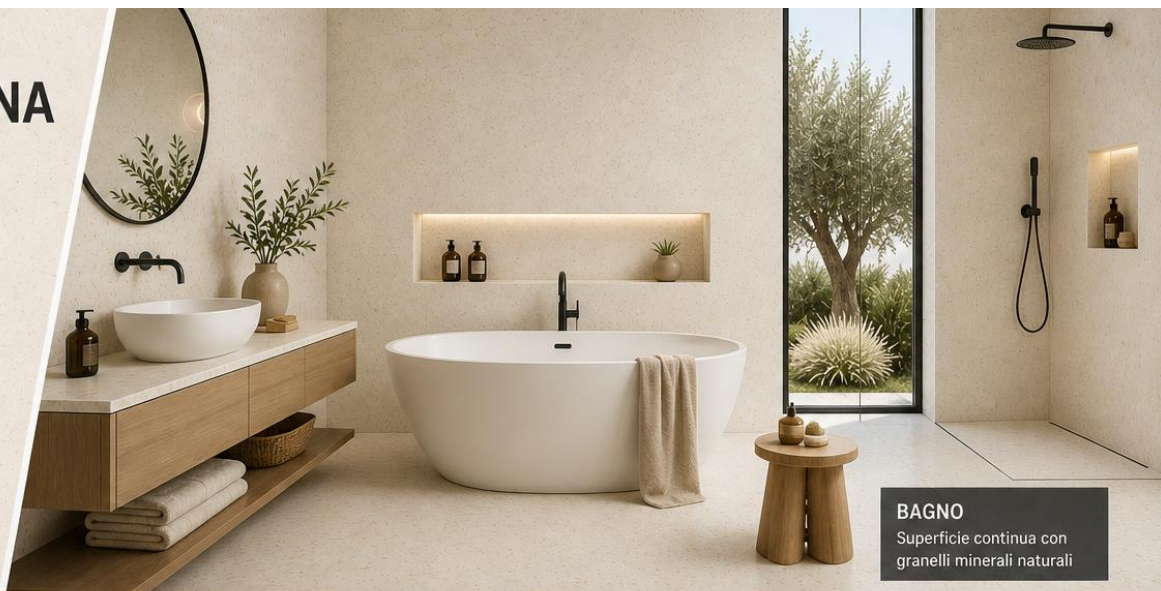
BAGNO Superficie continua con granelli minerali naturali