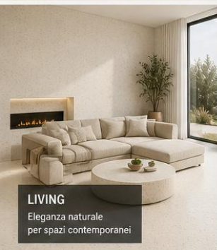
LIVING Eleganza naturale per spazi contemporanei